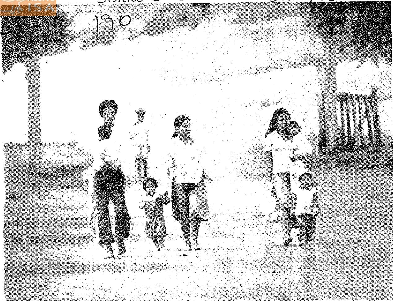
A disputa pelo poder nas reservas indias obriga famílias inteiras a deixarem seus lares