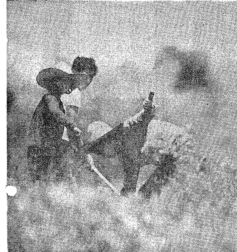
O arrendamento de lavouras aos brancos é prática usual