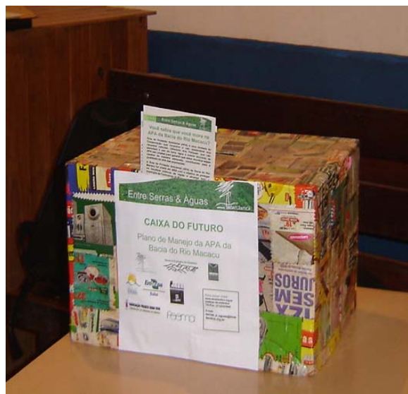
Caixa do Futuro