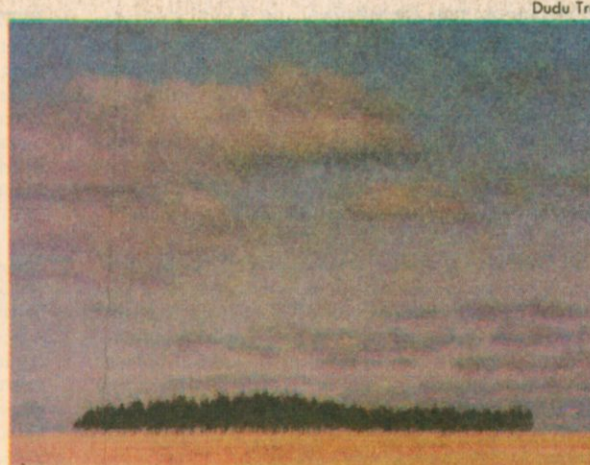
Eucaliptos de São Borja (RS)