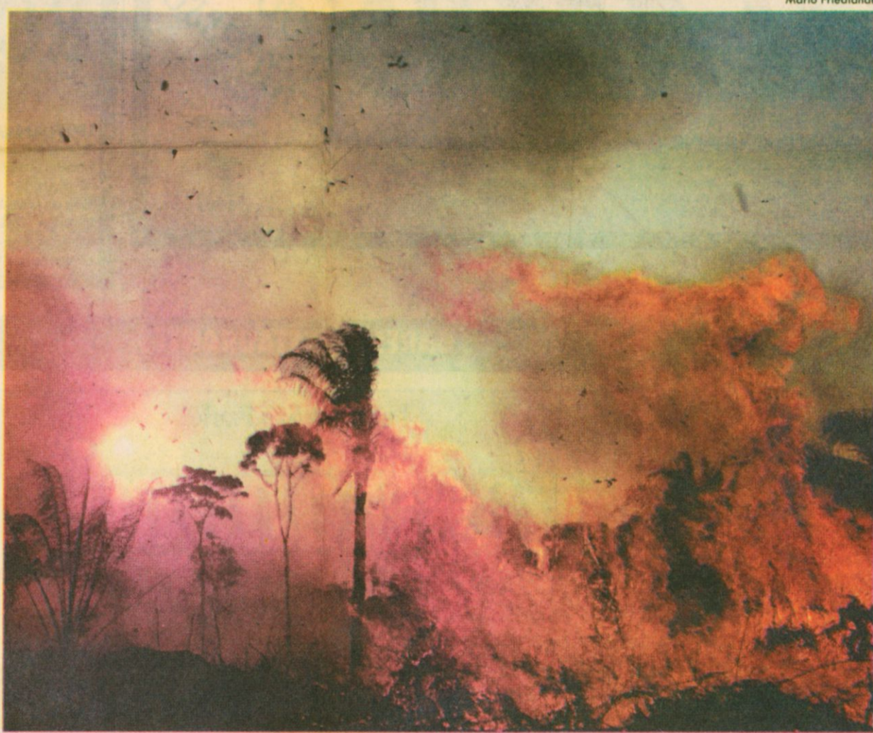
A Chapada dos Guimarães destruída pelo fogo em foto tirada pelo ativista ecológico Mario Friedlander em 1989

Livro 'Verde Lente — Fotografias Brasileiras e a Natureza', organização de Zé de Boni, Editora Empresa das Artes, 228 págs., R$ 84,00. Lançamento dia 8 de maio, às 18h30, no MAM