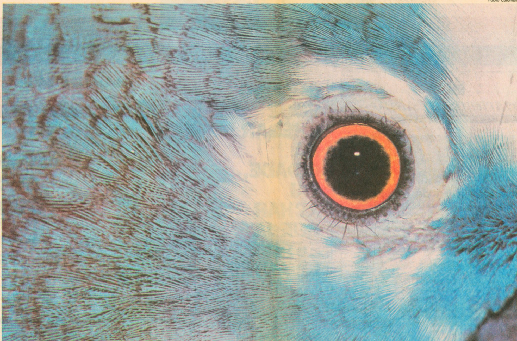
Olho de papagaio fotografado por Fabio Colombini em 91: trabalho integra o livro 'Verde Lente — Fotografias Brasileiras e a Natureza',...

...que será lançado no vernissage da exposição de mesmo nome no dia 8 de maio, no Museu de Arte Moderna (MAM) de São Paulo