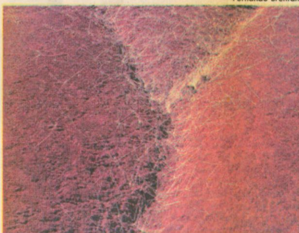
'Mãe Terra', de Fernando Brentano: associação entre natureza e forma feminina