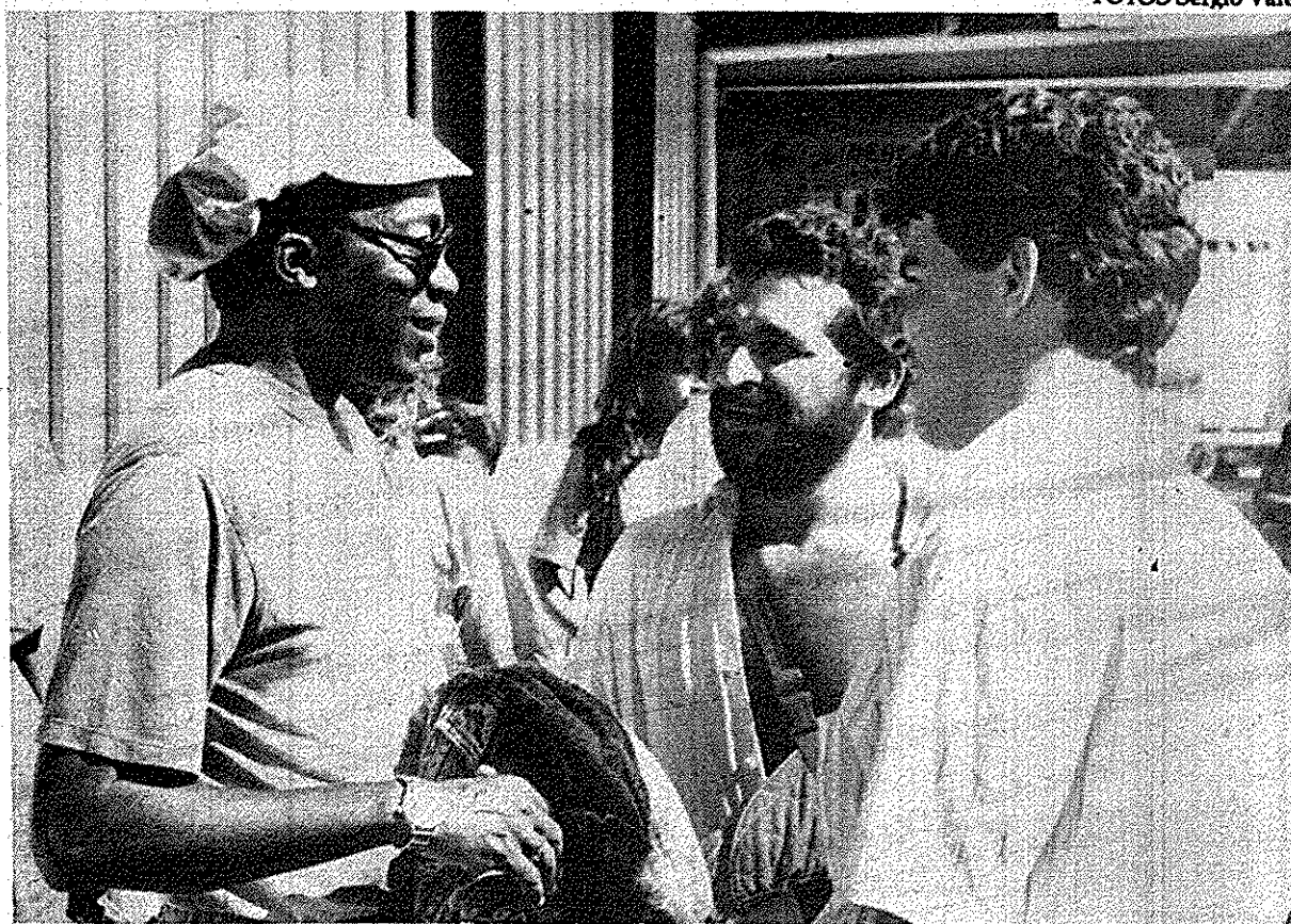
Milton foi recepcionado no Acre pelos componentes do Conselho Nacional dos Seringueiros