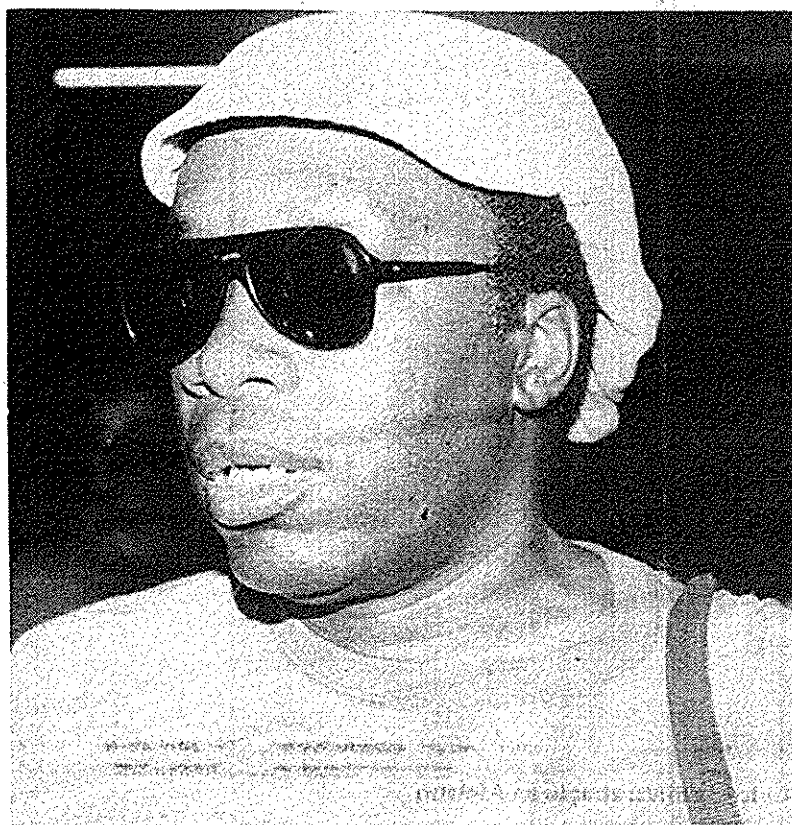
Milton-Nascimento: Txai faz única apresentação com ingressos esgotados