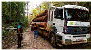
Tratoristas, com o apoio de um caminhão, quebra a barreira de vegetação para a construção de uma estrada

NOVA FRENTE Pássaros predadores no Sul Colônia de aves em contato com o Brasil e a Argentina. Há 100 milhões de aves em risco de extinção