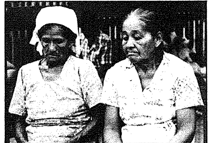
As duas terenas da família Lili são da fase pioneira do Lar União