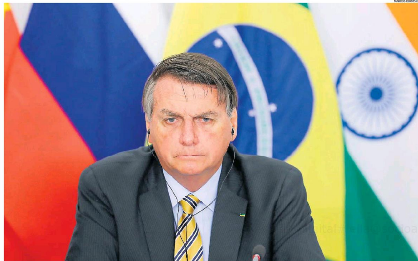
Ameaça. Descontente com queixas externas sobre sua política em relação à Amazônia, presidente promete expor países envolvidos em negócio irregular

Na prática, um país que importa madeira pode até achar que adquiriu produto 100% legal, quando, na realidade, sua origem pode ser fruto de esquema fraudulento, que costuma inviabilizar o preço do mercado entre os que desejam atuar de forma legalizada. Foi o que concluiu o Ministério Público na Operação Arquimedes.