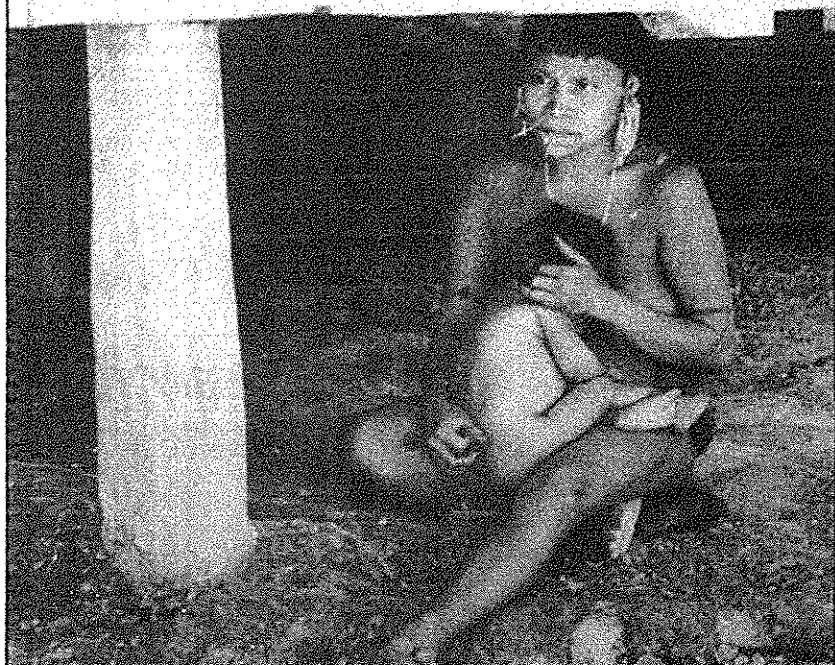
Ianomami descansa no posto da Funai; sob o piso, índia segura criança no colo

al é de cerca de 220 mil pessoas. "Eram seis milhões quando o Brasil foi descoberto", disse o ministro. Segundo ele, o interesse do país na demarcação dessas terras se baseia em três aspectos: o direito dos indígenas, a preservação cultural e a manutenção de reservas ecológicas. Apesar de o usufruto dessas terras ser dos índios, a posse das terras será da União.