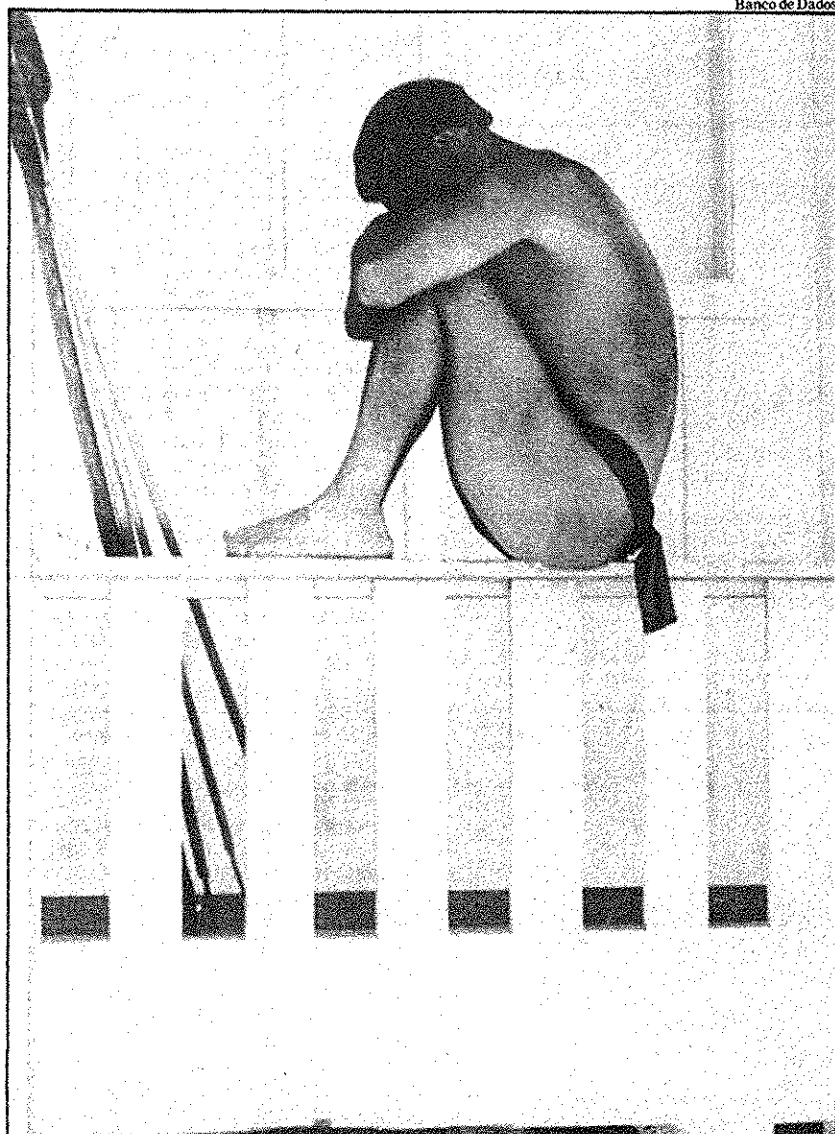
Banco de Dados