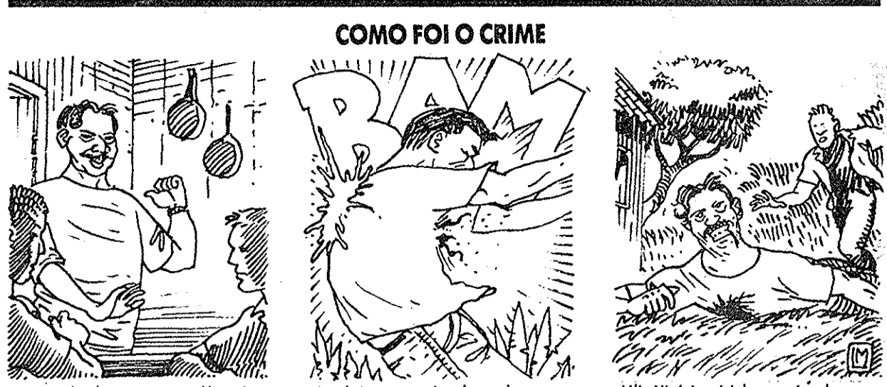
COMO FOI O CRIME

O advogado Márcio Thomaz Bastos, assistente de acusação dos acusados do assassinato do líder sindical Chico Mendes, refutou ontem as declarações do ministro da Justiça, Jarbas Passarinho. O ministro disse que "há o perigo de que o advogado de defesa peça a anulação do julgamento, alegando que o júri foi coagido". Segundo Thomaz Bastos, "qualquer advogado sabe que a nulidade de um julgamento deve ser baseado em fatos e condutas concretas, devidamente provados e avaliados por Tribunal de Justiça".