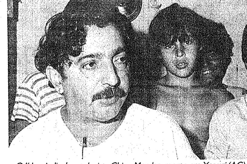
O líder sindical e ecologista Chico Mendes, morto em Xapuri (AC)

Da Redação No Natal de 1988, três dias depois de sua morte, o último depoimento de Chico Mendes ganhou força na imprensa: "Tenho esperança de ficar vivo. É vivo que a gente fortalece essa luta". "Ao público e enterro numeroso não salvarão a Amazônia", disse a Edilson Martins, do "Jornal do Brasil", em 9 de dezembro, no Rio. No 3º Congresso Nacional da CUT, em 9 de setembro de 1988, deu uma longa entrevista. Veja alguns trechos: Pergunta — Como a proposta de aliança entre os povos da floresta mudou o contexto de defesa da Amazônia? Chico Mendes — A região estava se tornando um enorme pasto. O objetivo era a especulação: desmatavam 2 mil hectares de floresta virgem, plantavam mil ha de pastagem. Assim, não tinha como o seringueiro viver. Criou-se em 1985 o Conselho Nacional dos Seringueiros por iniciativa do sindicato. Até aquele momento vivíamos uma luta isolada. O Encontro Nacional dos Seringueiros, em outubro de 85, em Brasília, contou com observadores nacionais e internacionais, e começou a crescer essa consciência de aliança, com os índios, já que as lutas eram iguais. Pergunta — O sindicato de Xapuri é só de seringueiros? Chico Mendes — Principalmente seringueiros. Mas ele atua também com colonos, alguns pedões de fazendas. Temos em Xapuri 3 mil filiados.