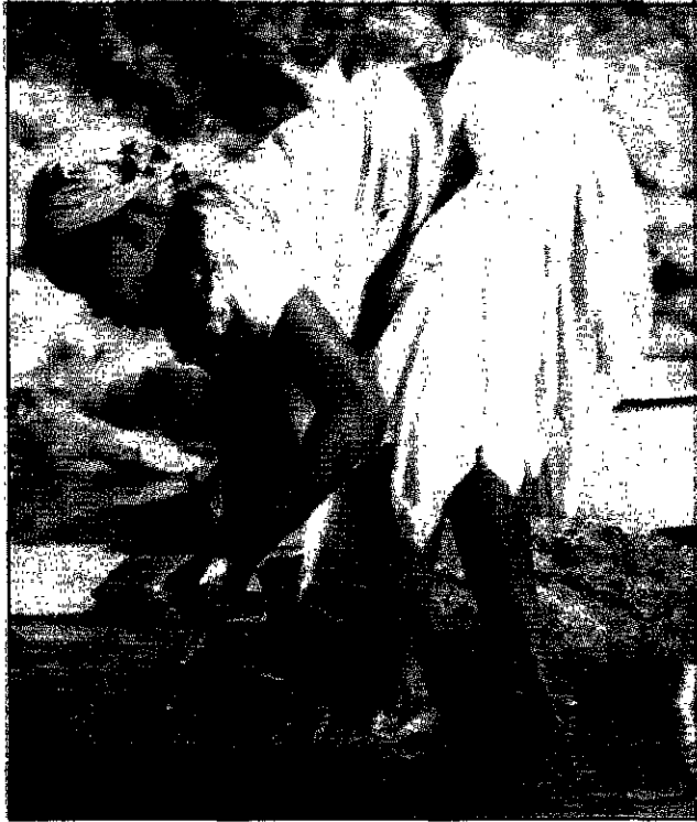
Povo dos quilombos de Goiás é tema de exposição fotográfica

Serão expostos 40 trabalhos, escolhidos entre as 750 feitas por Souza em um período de 21 dias. O fotógrafo percorreu núcleos da comunidade espalhados pelas serras e vãos do Planalto Central. ■