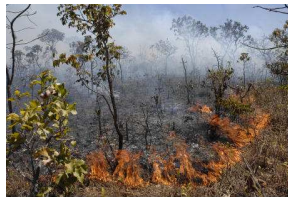
Queimadas e incêndios florestais