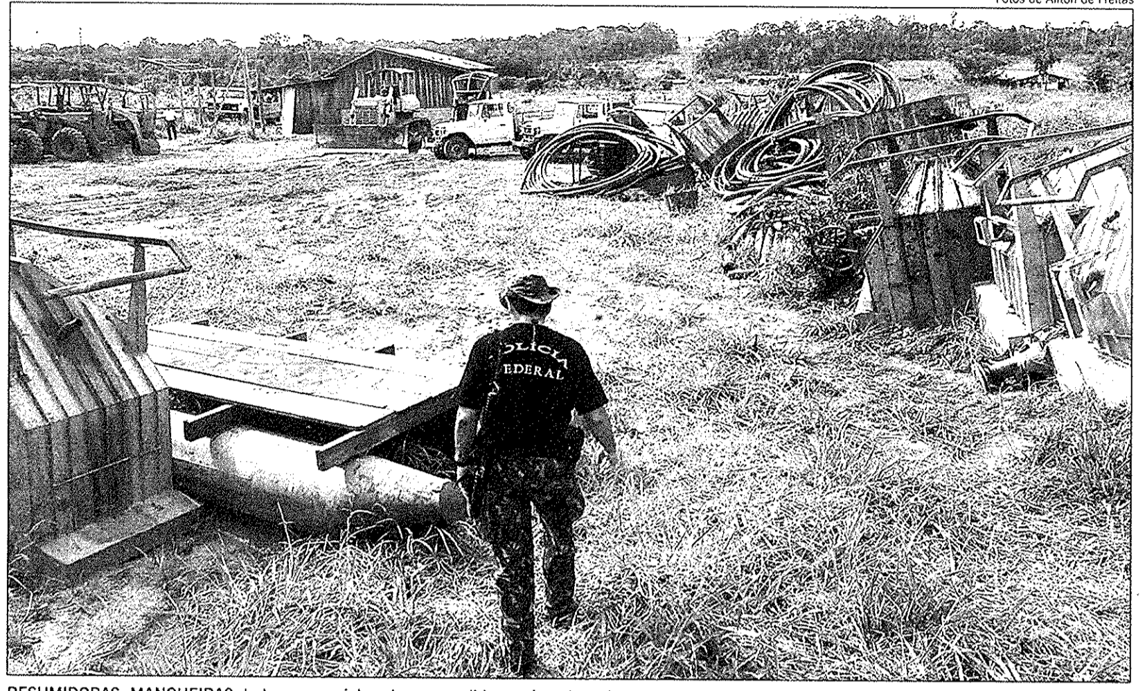
RESUMIDORAS, MANGUEIRAS, tratores e caminhonetes apreendidos na área de garimpo da reserva Roosevelt, dos cinta-largas, em Rondônia