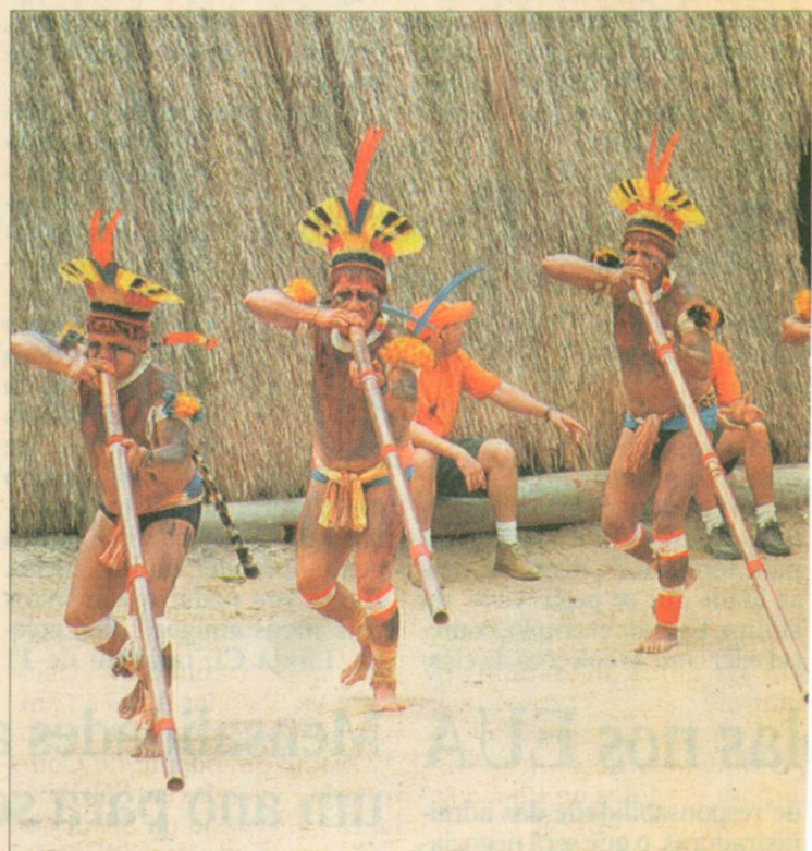
Índios da região do Alto Xingu preparam dança: tradições

Ontem, na Câmara Municipal de São Paulo, os cerca de 2 mil índios que vivem na cidade foram homenageados com o evento A Terra Sem Males que Queremos, que faz uma alusão ao tema da campanha da fraternidade. Sesenta índios das comunidades dos guaranis – que vivem em Parelheiros e no Pico do Jaraguá – e dos pancararus (que estão presentes em bairros como Jardim Elba, Parque Santa Madalena e favela de Paraisópolis) participaram das comemorações.