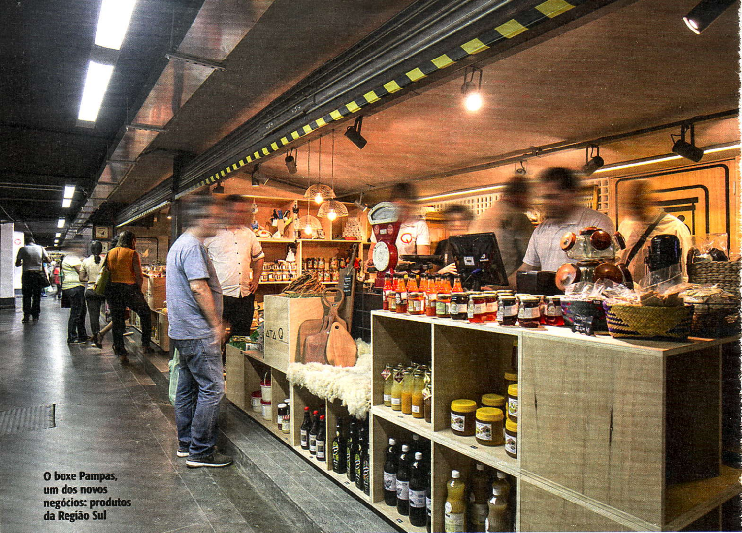
O boxe Pampas, um dos novos negócios: produtos da Região Sul