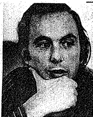
Hemming: sem preconceito.