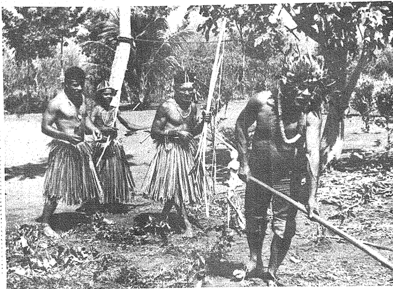
Os índios da tribo Xucuru-kariri vão ter tetelefone já a partir do mês de janeiro

A comprovação do que afirma o diretor presidente da Telasa está também no seu projeto de colocação em Alagoas 50 mil telefones públicos que servirão não apenas a Capital, mas também ao interior do Estado.