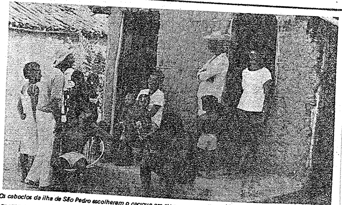
Os caboclos da ilha de São Pedro escolheram o cacique em eleições diretas.