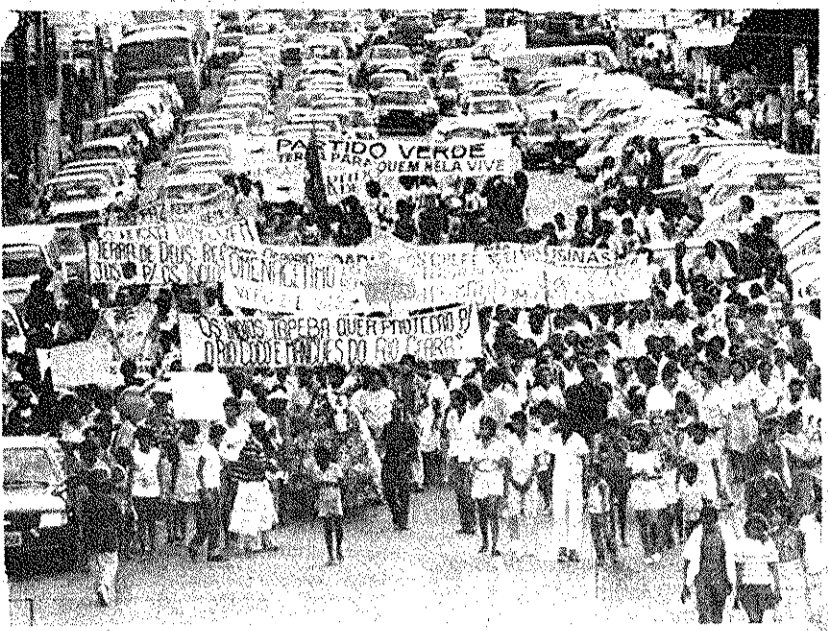
A caminhada da adesão aos Tapebas parou o trânsito na Beira-Mar