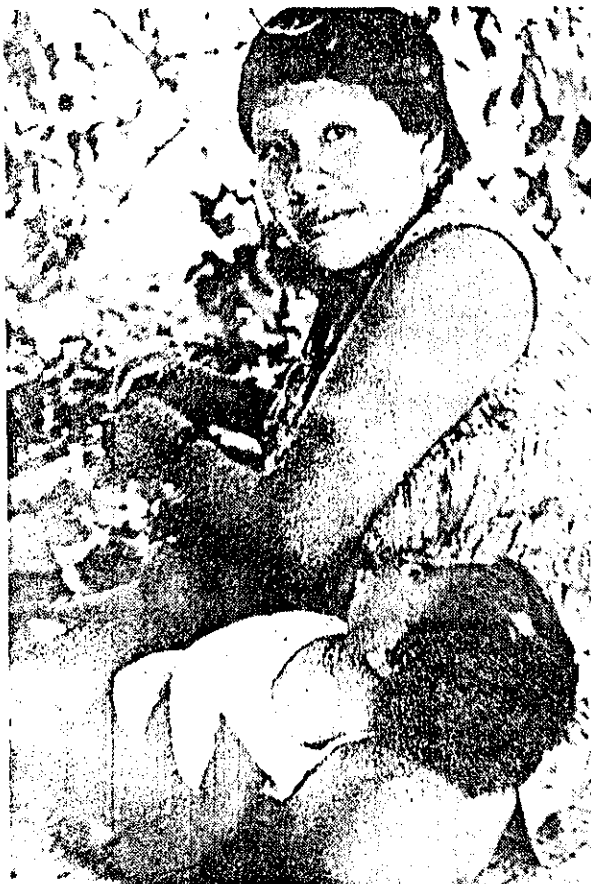
A obesidade também é problema nas aldeias indígenas