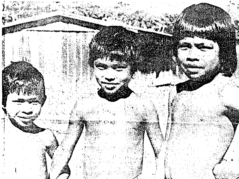
Crianças suruíis estão desnutridas devido à mudança de hábitos alimentares de sua tribo