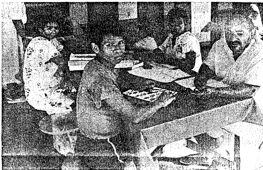
A Casa do Índio recebe pacientes de todo país que necessitam de tratamento especializado