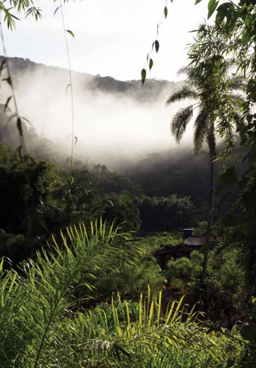
Mata preservada no bairro de Pedro Cubas: entre a serra e a estrada