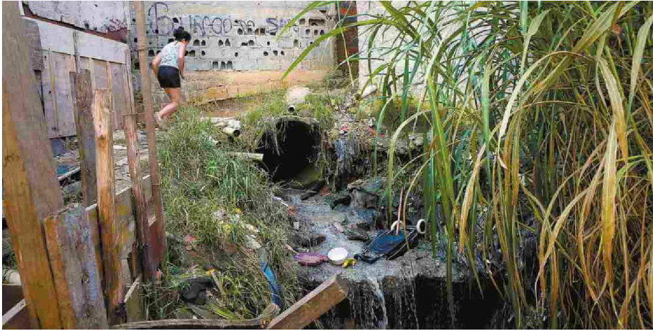
Fossa a céu aberto na favela do Tanque, no bairro de São Mateus, zona leste de SP; saneamento avança pouco no país

Em seguida aparecem as cidades de Maringá (PR) e Limeira (SP).