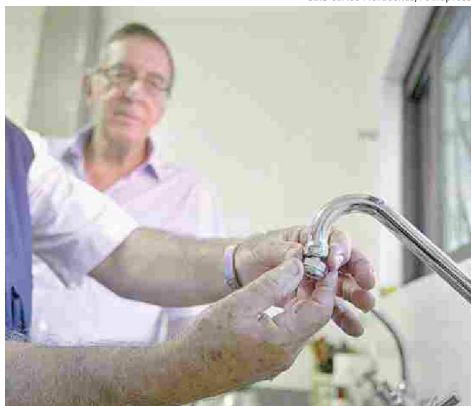
Sabesp começou a distribuir kits de economia de água

“Quisemos que a sobretaxa se referisse especificamente ao que é entendido como consumo de água”, justificou