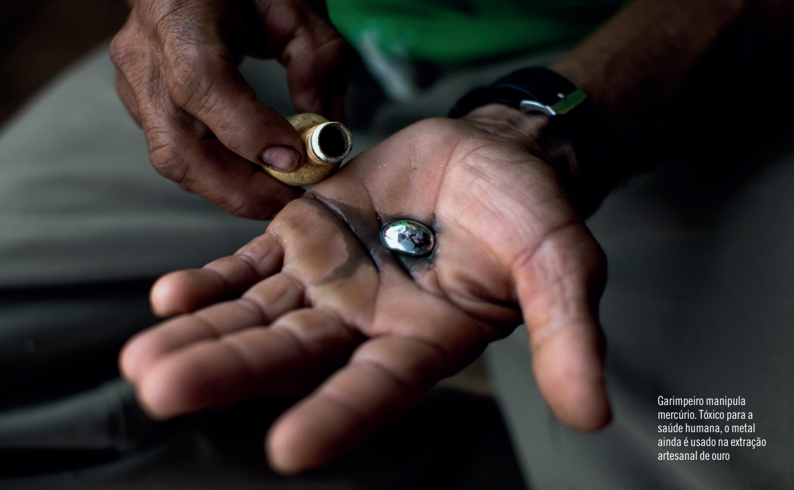
Garimpeiro manipula mercúrio. Tóxico para a saúde humana, o metal ainda é usado na extração artesanal de ouro