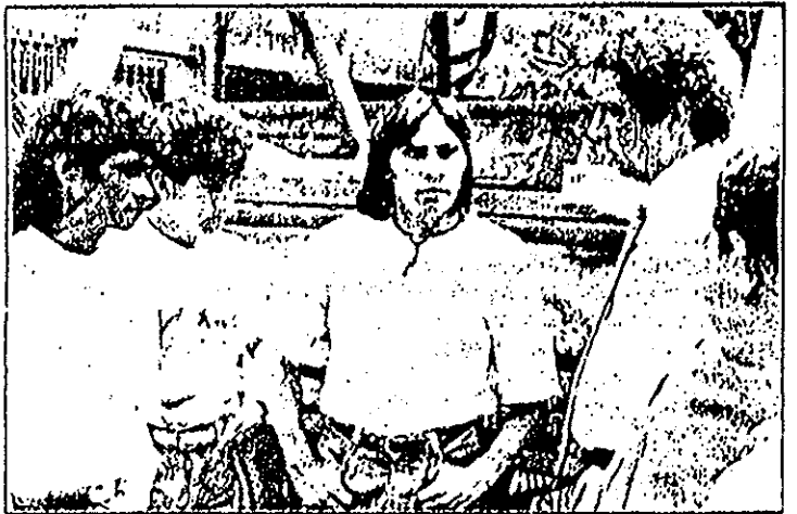
Governador conversa com representantes dos índios