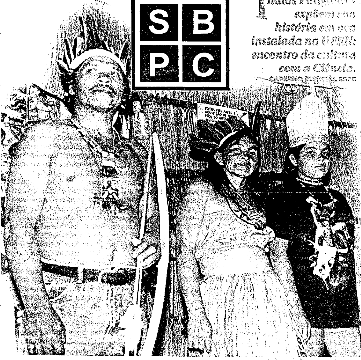
FOTOS PRONANTE A AQUISIÇÃO DE PEDA DO MUSEU TITULO

Índios Patigamra explicam sua história em uma instalada na UFRN: encontro da cultura com a Ciência.