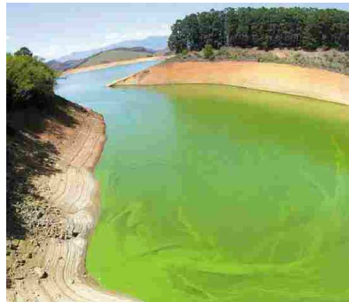
Usina de Funil, instalada nas águas do rio Paraíba do Sul

É a pior marca desde agosto de 2001, quando o nível chegou a 3,92%, segundo Furnas, subsidiária da Eletrobrás