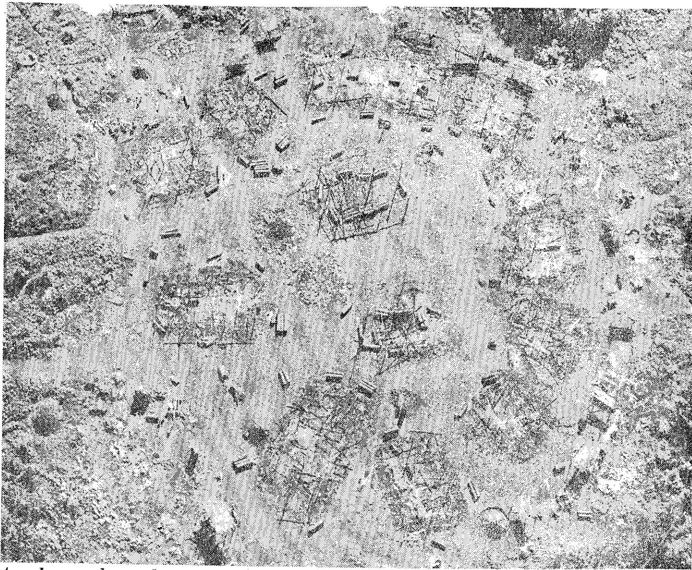
Acuados na selva, os kreen-akarores queimaram a aldeia e optaram pela amizade dos brancos

Em Brasília, a Funai prepara o VII Congresso Interamericano de Indigenismo. No relatório que o Chanceler Mário Gibson Barbosa enviou ao Presidente Médici, afirma que o encontro dará "grande projeção internacional para o país, no que diz respeito ao tema e à política adotada no setor pelo nosso Governo." (Página 7)