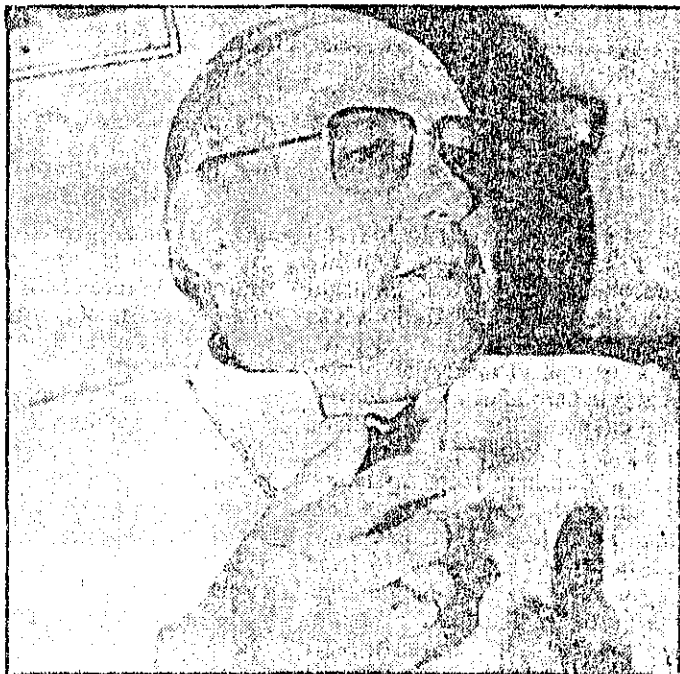
Antonio Ignacio Velazco, obispo de la región amazónica venezolana

*Nuestros pueblos deben tener una mayor sensibilidad por nuestros pueblos indígenas. Nos faltan recursos para los pueblos más pobres y así podríamos tener las oportunidades de otros.