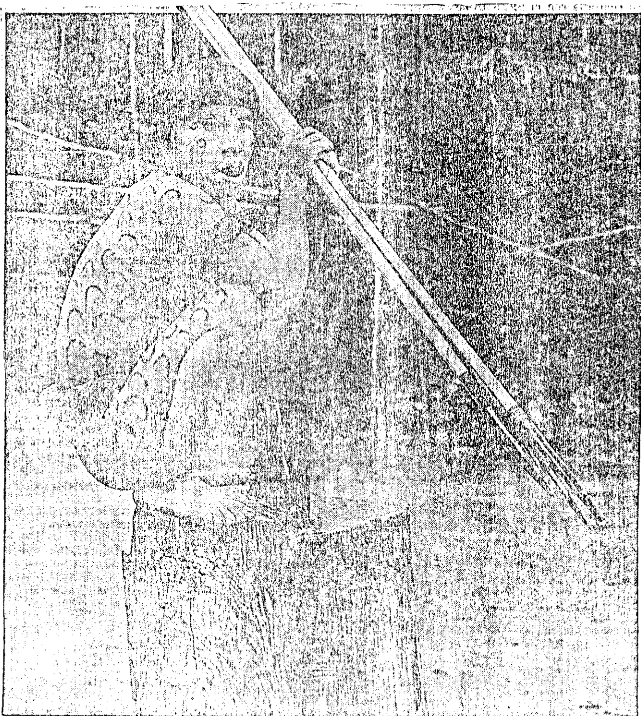
El Yanomami sin amparo en su tierra