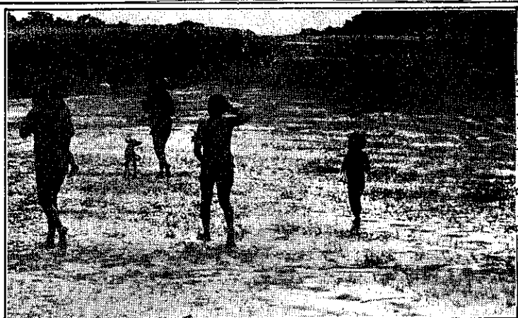
Os índios perdem terreno para os garimpeiros