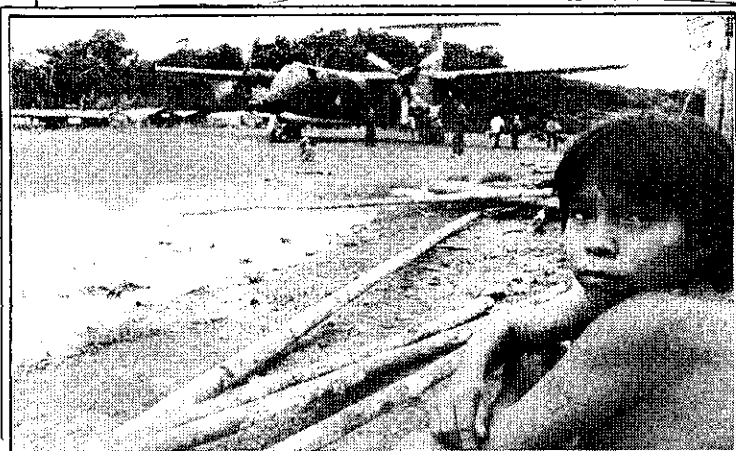
Os aviões desembarcaram milhares de garimpeiros