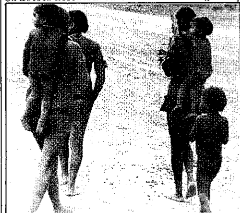
A saída: ir cada vez mais longe.