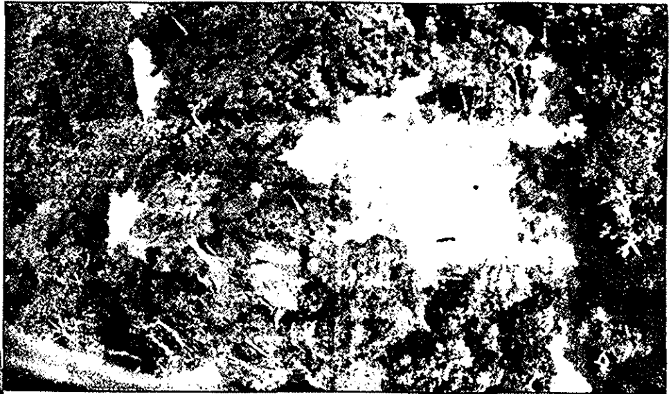
Un claro causado por la tala de la selva, visto desde un helicóptero

La película será vista por unos 200 millones de personas en América y Europa. Se desarrollará como un doble viaje en la geografía y en la historia y estrará cómo viven los hombres en sus riberas y de qué manera se relacionan con el río