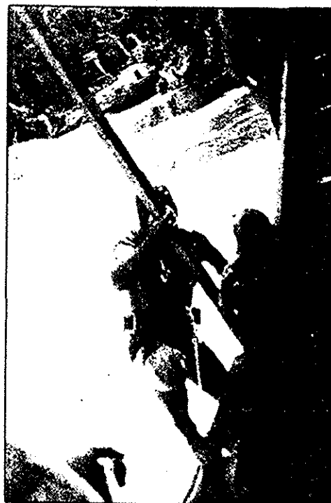
Un buzo brasileño es obligado a salir del agua por efectivos de la Guardia Nacional

—El filme —apuntaron— permitirá, a través de la metáfora del viaje del pasado al presente y re-