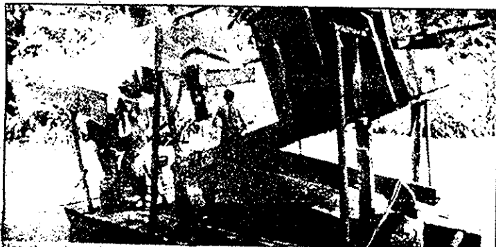
Una chupadora y lavadora de oro utilizada por los mineros brasileños para extraer y lavar los minerales del río, en cuyo proceso utilizaban mercurio, uno de los elementos más contaminantes de la naturaleza