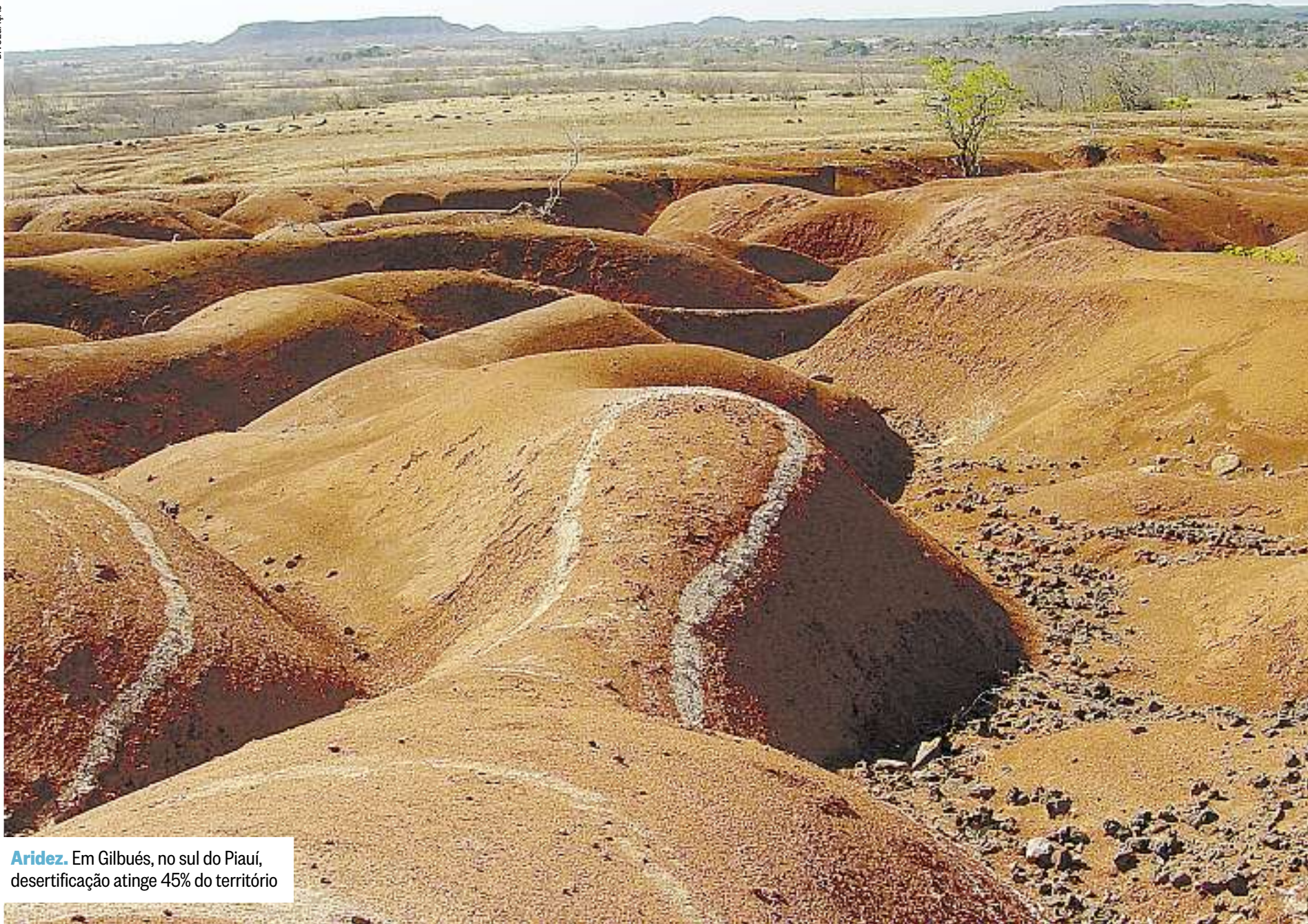
Aridez. Em Gilbués, no sul do Piauí, desertificação atinge 45% do território

meira, Carneiros, Pariconha, Água Branca e Delmiro Gouveia.