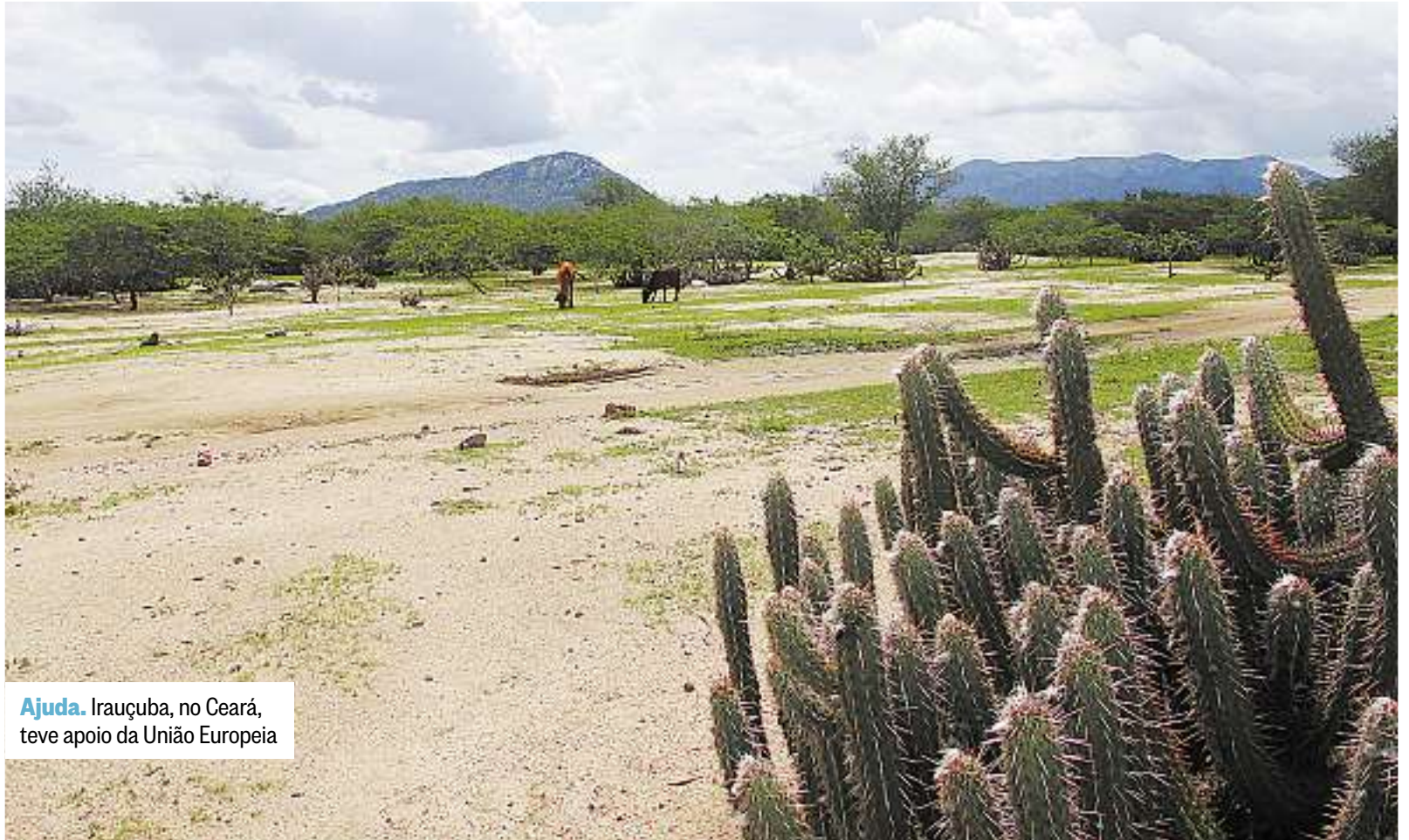
Ajuda. Irauçuba, no Ceará, teve apoio da União Europeia