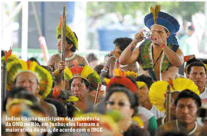
Índios tikuna participam de conferência da ONU no Rio, em junho; eles formam a maior etnia do país, de acordo com o IBGE

Um grupo de 400 índios da etnia Guarani-Kaiowá foi atacado por pistoleiros ontem, após montar acampamento em uma fazenda em Paranhos (MS). A área é homologada. Segundo o Conselho Indigenista Missionário, um índio de 50 anos desapareceu após o ataque.