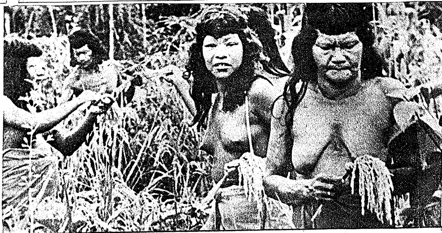
Mesmo sem o consentimento pacífico dos brancos, os índios terão suas terras demarcadas até outubro deste ano, quando expira o prazo.