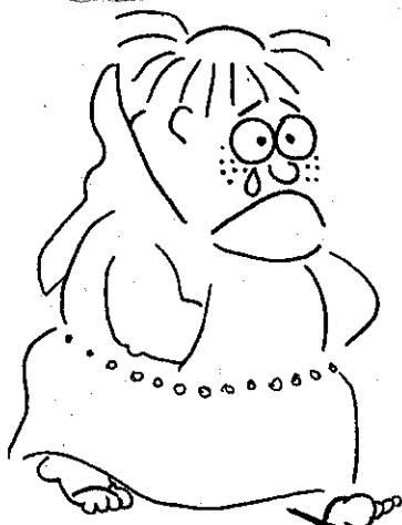
Resda DEPOIS DO MESTRE HENFIL

O governador disse também que o presidente da Funai lhe prometeu enviar à região de Tocantinópolis funcionários do órgão para interceder junto aos índios, "a fim de evitar acontecimentos que possam intranquilizar a população do Extremo Norte de Goiás". E que o Governo do Estado está atento para o problema, porque "na realidade os indígenas acharam por bem — sem a orientação de técnicos — estabelecer lá uma divisa, o que está trazendo intranquilidade no seio dos proprietários. Mas nós julgamos por bem solicitar a presença do Presidente da Funai naquela região, para que com a participação possamos restabelecer um clima de normalidade, de tranquilidade no município de Tocantinópolis".