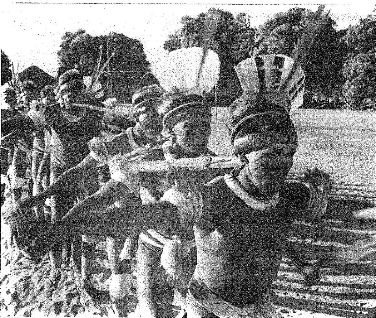
Índios comemoram anualmente o Kuarup, a liberação da alma dos mortos importantes