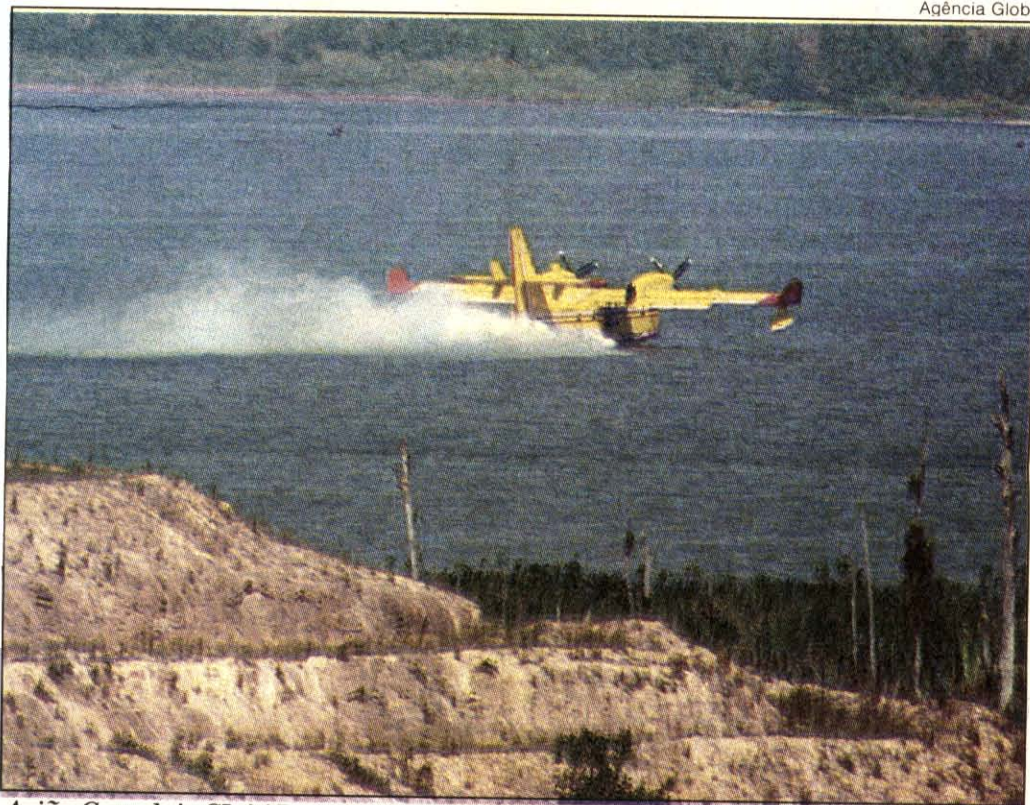
Avião Canadair CL-415: recolhendo água para despejar na reserva de Poço das Antas

O incêndio já destruiu mil hectares de mata, 20% da área. Outro incêndio, ocorrido em 1991, devastou 1,2 mil hectares. Poço das Antas é o único habitat natural no Brasil do mico-leão-dourado, ameaçado de extinção.