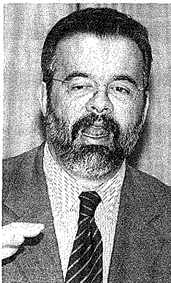
Jungmann: “Esta é a maior área protegida do planeta”

Maior que a Bélgica, o parque terá setores específicas para ecoturismo e pesquisa ambiental. Está situado numa área especial de preservação da biodiversidade em floresta