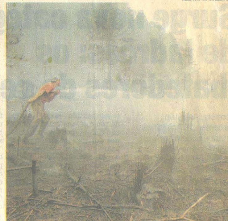
INCÊNDIO NO PARQUE: fogo consumiu parte do Anhangüera