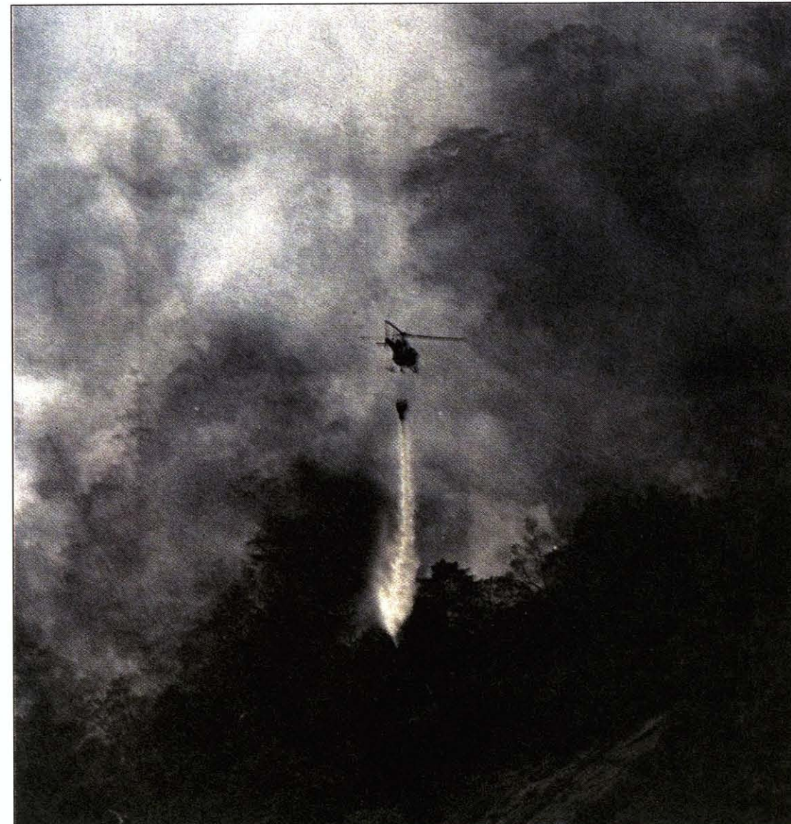
O APARELHO DESPEJA a água sobre a mata para controlar o incêndio na encosta da Pedra da Gávea

No início do mês, 60 hectares foram destruídos por um incêndio nas reservas biológicas de Poço das Antas (em Silva Jardim) e União (entre Casimiro de Abreu, Macaé e Rio das Ostras). O número de incêndios este mês já é quase seis vezes maior que a quantidade registrada em junho de 99, com 166 casos. ■