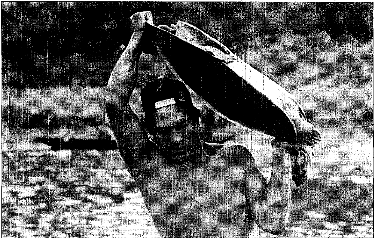
Uma operação de salvamento está sendo feita, com peixes e tartarugas sendo transferidos de áreas

nuição do nível de água do Rio Araguaia.