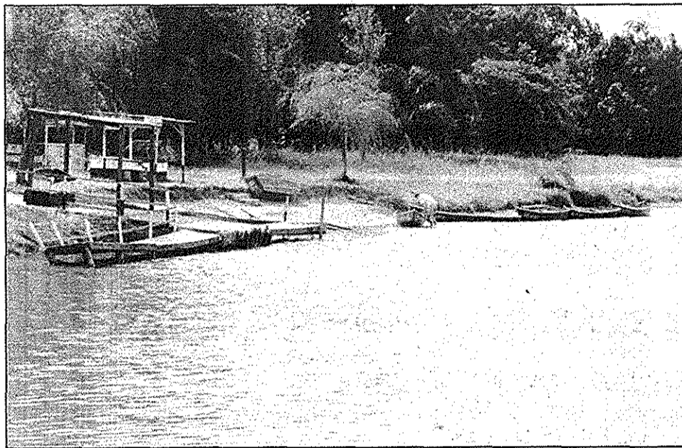
O lago, com barcos para aluguel: abandono dos últimos anos afastou visitantes