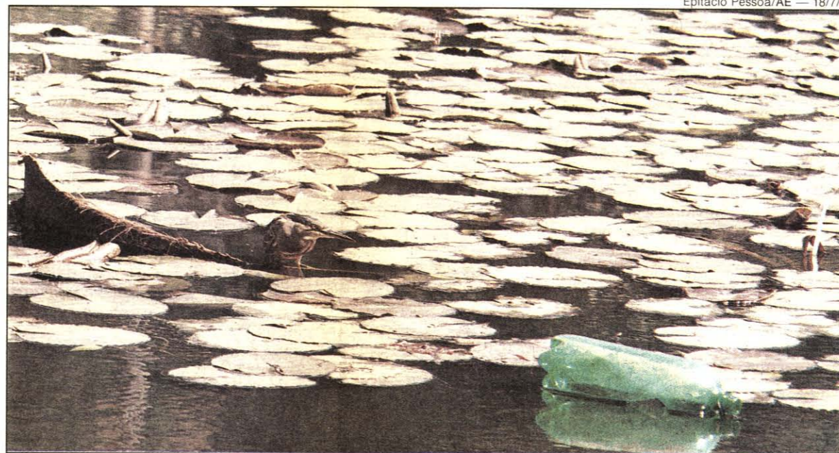
Sujeira no lago: Parque Estadual Alberto Löfgren estava abandonado e sem dinheiro para manutenção

uma reportagem sobre o abandono do parque. Faltava dinheiro para a manutenção. Nos lagos, havia garrafas e papéis boiando. A sujeira também se