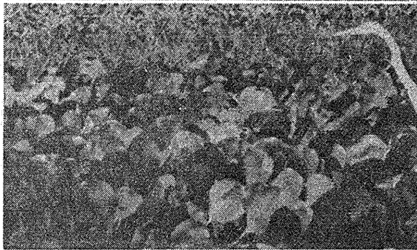
Criado em 1961 e extinto agora, o Parque de 7 Quedas na verdade nunca existiu. E o pouco que sobra vive sob ameaça constante