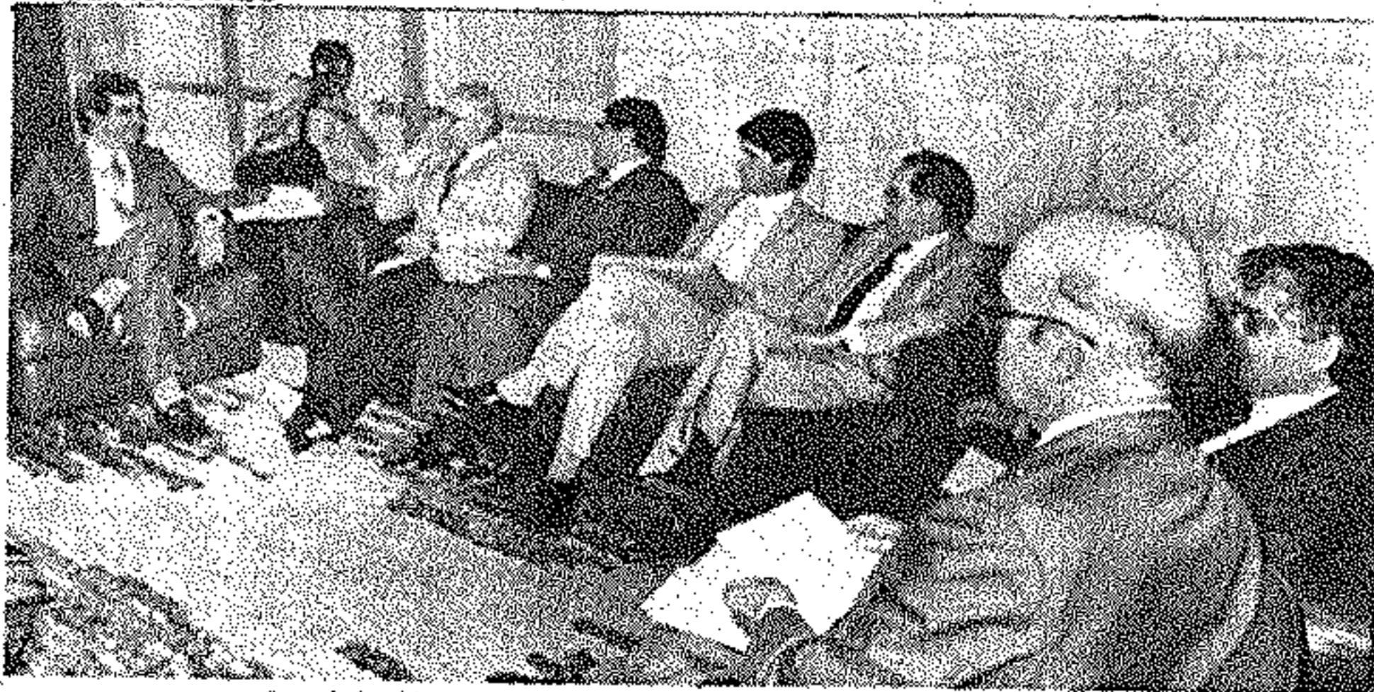
...as autoridades resolviam a vida deles no gabinete