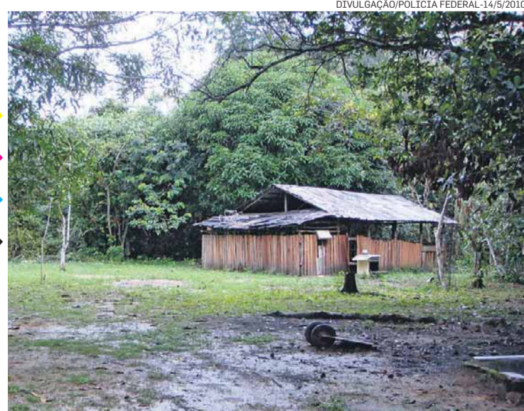
Base. Sítio na região de Manaus organizava a comunicação

Também há outras duas razões para a expansão. Primeiro, a política de segurança do governo Álvaro Uribe empurrou a guerrilha para locais isolados, como a fronteira. Com isso, os países vizinhos se tornaram importantes fontes de abastecimento de armas e insumos. O segundo fator é que o mercado europeu está conquistando cada vez mais peso, enquanto o dos EUA está saturado. E o Brasil está na rota para a Europa.