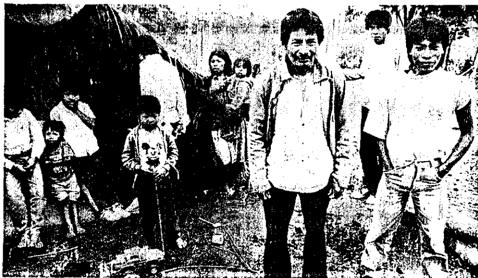
Tribo de Terra Fraca vive com venda de cestos, não é catequizada e crianças só falam o idioma guarani

Já a tribo que vive há um ano e meio em Terra Fraca, não é catequizada e suas crianças, até os 12 anos, só falam o idioma