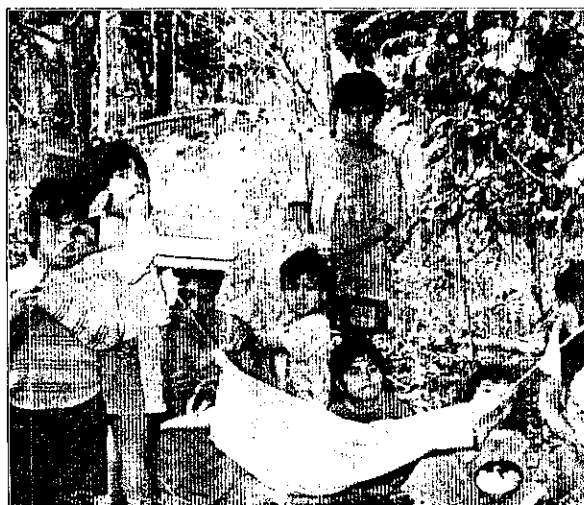
Desde junho do ano passado os índios estão em área próxima à Usina, em Foz.

Em 1982, após negociações com a Funai e o Instituto Nacional de Colonização e Reforma Agrária (Incrá), Itaipu cedeu uma área de 253 hectares para o assentamento da comunidade, em São Miguel do Iguacu.