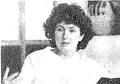
Manuela: Índios estão ameaçados.

pequenos grupos de garimpeiros que invadem a terra Yanomami utilizando os rios como vias de acesso, até verdadeiras ocupações paramilitares, como a ocorrida em 1985, quando, a partir de Manaus, capangas liderados por empresários regionais, vestindo uniformes do Exército e armados até com metralhadoras, ocuparam o posto indígena de Surucucus (próximo ao centro de concentração dos Yanomami), após desembarcarem na pista de pouso local. Somente com uma ampla e imediata mobilização da opinião pública, liderada pela Comissão pela Criação do Parque Yanomami (CCPY), conseguiu-se que a Polícia Federal expulsasse os invasores.