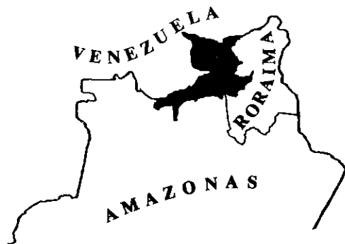
Os Yanomami vivem no Norte do País.

Cláudia Andujar, coordenadora da Comissão pela Criação do Parque Yanomami, acrescenta outro dado a essa discussão: do ponto de vista estrito da segurança nacional, o Exército deveria se