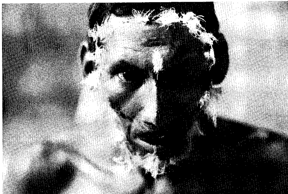
Índio Yanomami da região do Ericó.