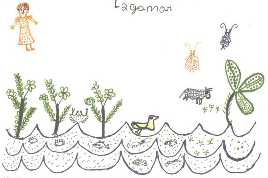
Almofala - Ceará