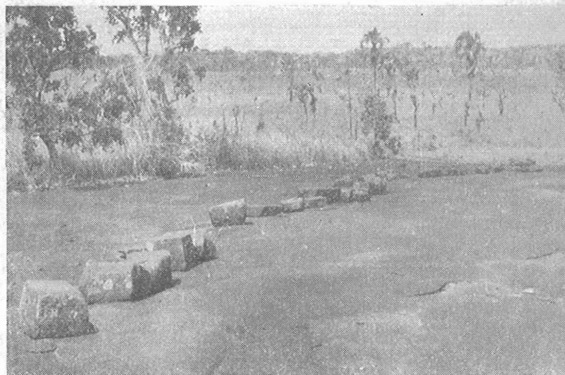
A fileira de pedras dos "Transformados" no lagedo do campo, perto do igarapé Wáipa